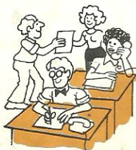
a la oficina